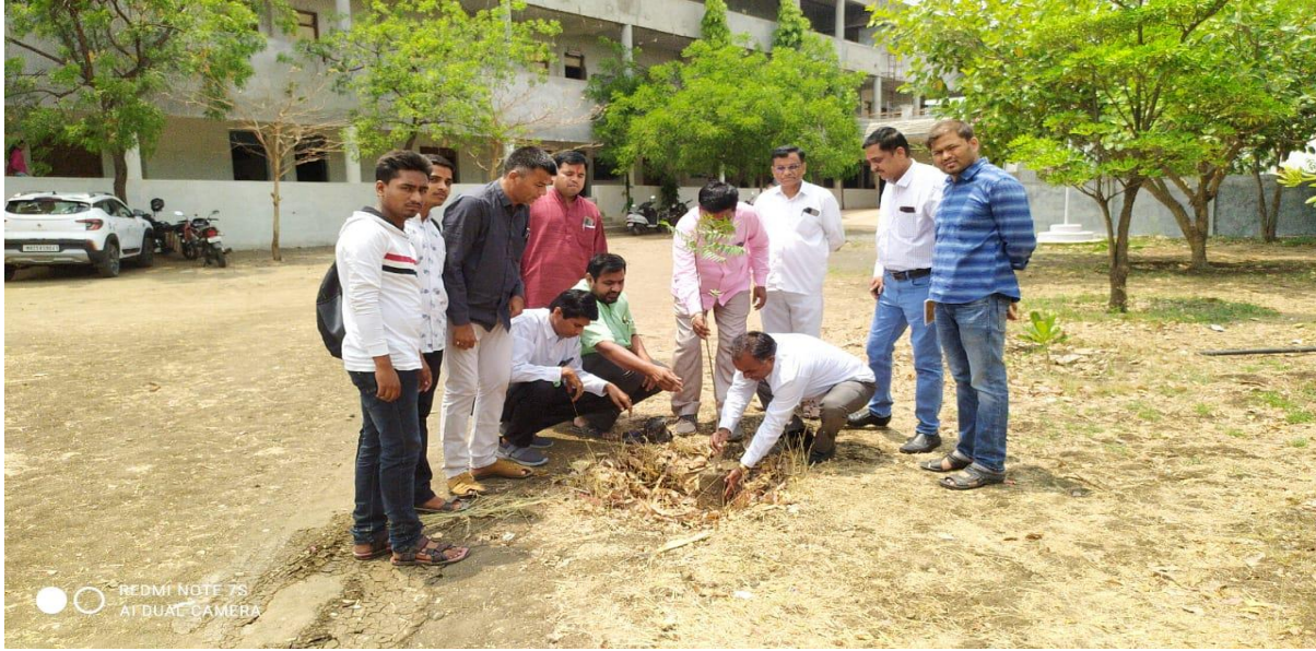
Tree Plantation on the occasion of 'Earth Day' 22 nd April 2022.