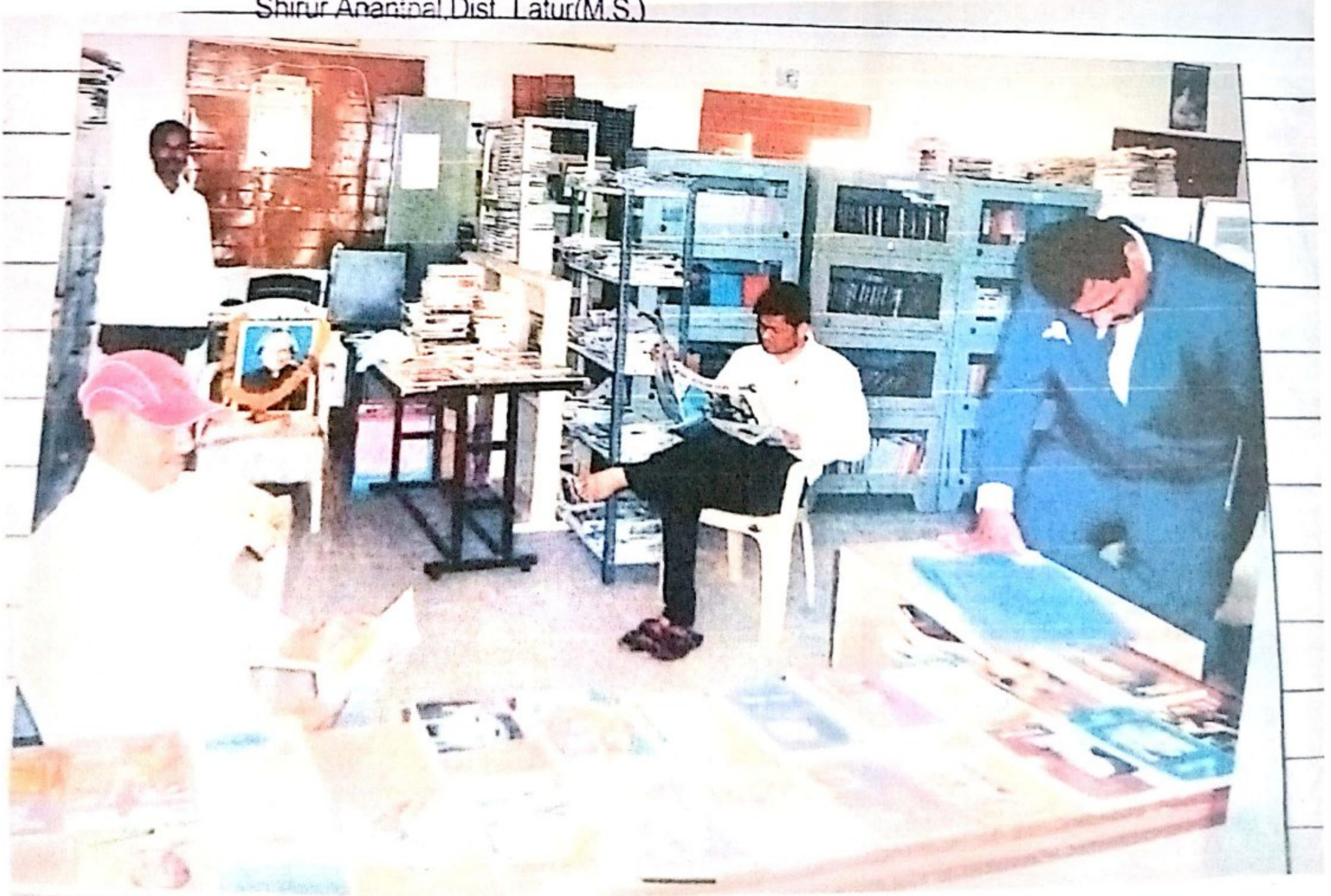
[Signature] LIBRARIAN Shivneri College, Shirur(A)