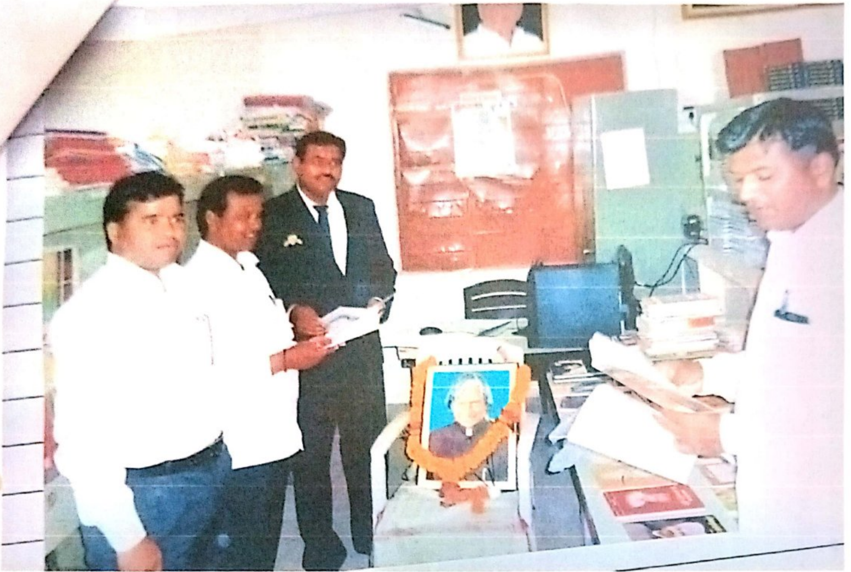
[Signature] PRINCIPAL Shivneri Mahavidyalaya (Arts, Commerce & Science) Shirur Ananjal, Dist. Latur(M.S.)